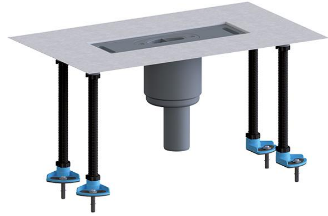
Душевой лоток HL53RVM/90