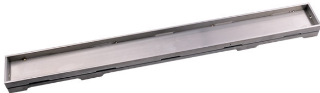
Рис. 4. Решетка HL0531I.

6.3. HL0531I – серия «Индивидуальная» решетка из нержавеющей стали с матовой поверхностью. Данная решетка предназначена для вклеивания в неё мозаики или облицовочной напольной плитки толщиной до 12 мм (включая плиточный клей)