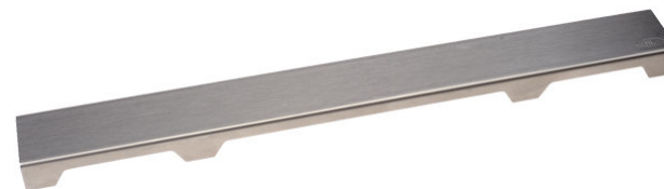
Рис. 2. Решетка HL0531S.

Данная решетка подходит для напольной плитки толщиной до 13 мм (включая плиточный клей)