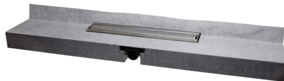
Душевой лоток HL531