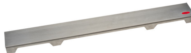
Рис. 3. Решетка HL0531D.