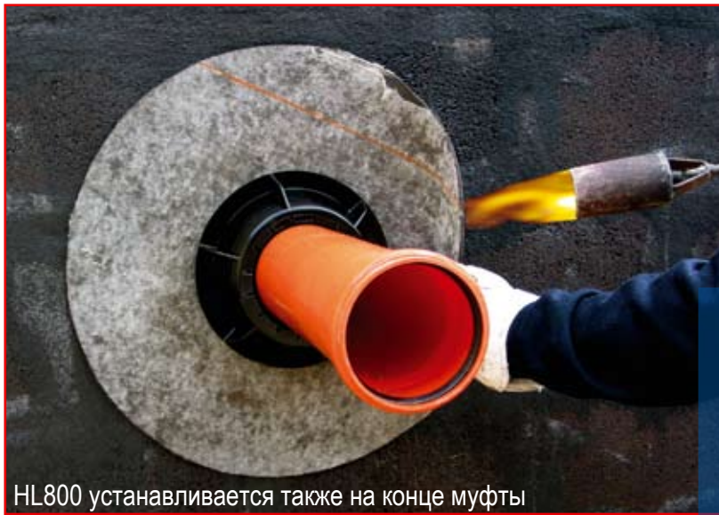
HL800 устанавливается также на конце муфты

HL800 - предназначен для герметичной заделки отверстия между трубопроводом и строительными конструкциями, при пересечении ввода со стенами подвала. (В соответствии с п.9.7. СНиП 2.04.01.-85*). Эластичная полимербитумная водонепроницаемая мембрана - очень эффективна и удобна в монтаже. HL800 одевается на гладкий конец трубы, затем полимербитумное полотно мембраны приваривается к битумному покрытию стены. После этого в ручную закручивается фиксирующая гайка из ПП, эластичная прокладка обжимается и очень плотно прилегает к трубе. Таким образом достигается герметичность соединения. Вода, находящаяся снаружи здания, не поступает вовнутрь, и стены подвального помещения остаются сухими. Это особенно важно для зданий, построенных во влажном климате, на склонах холмов или по берегам рек. HL800 одинаково хорошо зарекомендовал себя как при применении с пластмассовыми трубами (ПП, ПЭ или ПВХ), так и с трубами из чугуна и стали. HL800 очень легко устанавливается на неровные поверхности, в углах здания и т.п..