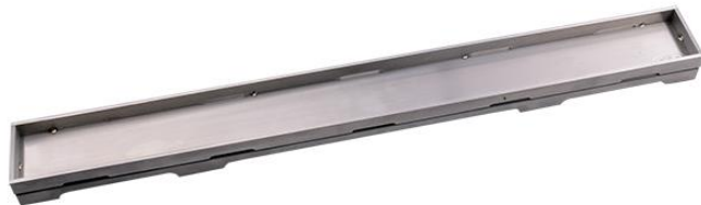
Рис. 4. Решетка HL0531I.

6.3. HL0531I – серия «Индивидуальная», решетка из нержавеющей стали с матовой поверхностью. Данная решетка предназначена для вклеивания в неё мозаики или облицовочной напольной плитки толщиной до 12 мм (включая плиточный клей)