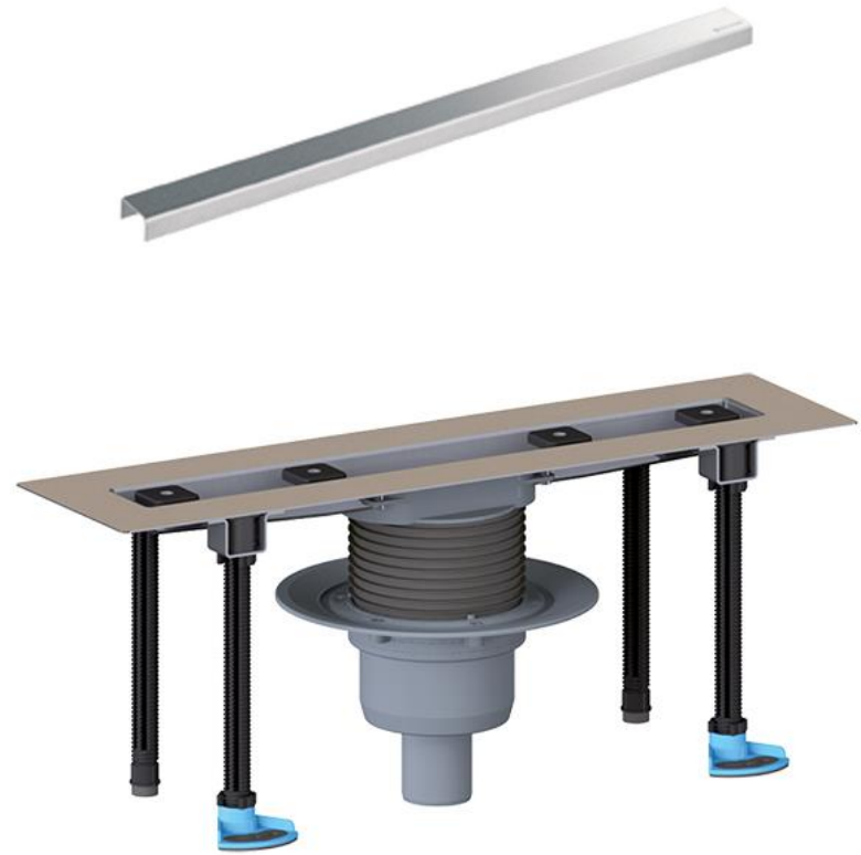
Душевой лоток HL50FV (HL50FV.0)